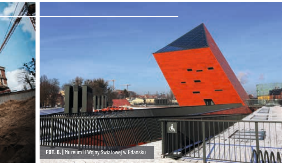
FOT. 6. | Muzeum II Wojny Światowej w Gdańsku

Wojciech Kwinta: Dziękuję i życzę wizji, które uda się zrealizować i oczywiście ciekawych wyzwań.