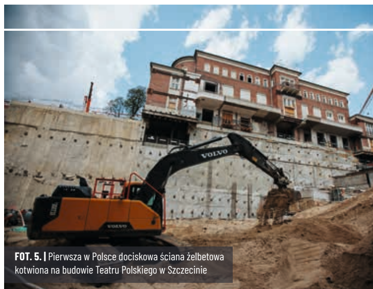
FOT. 5. | Pierwsza w Polsce dociskowa ściana żelbetowa kotwiona na budowie Teatru Polskiego w Szczecinie