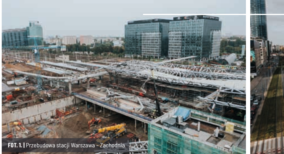
FOT. 1. | Przebudowa stacji Warszawa – Zachodnia

Innowacja w budownictwie to w dużej mierze ulepszanie istniejących lub tworzenie nowych technologii. Bez wkładu ludzkiego to się po prostu nie zadzieje.