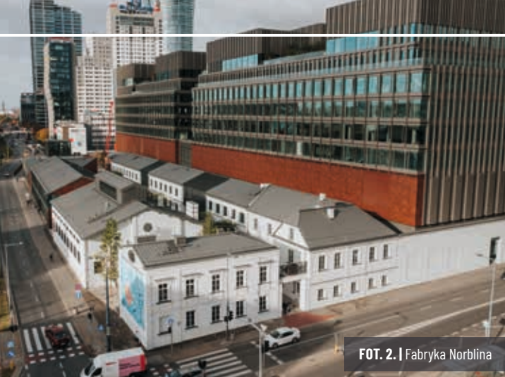
FOT. 2. | Fabryka Norblina