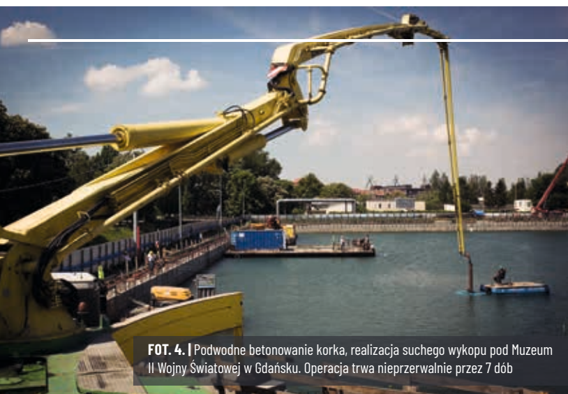
FOT. 4. | Podwodne betonowanie korka, realizacja suchego wykopu pod Muzeum II Wojny Światowej w Gdańsku. Operacja trwa nieprzerwanie przez 7 dób