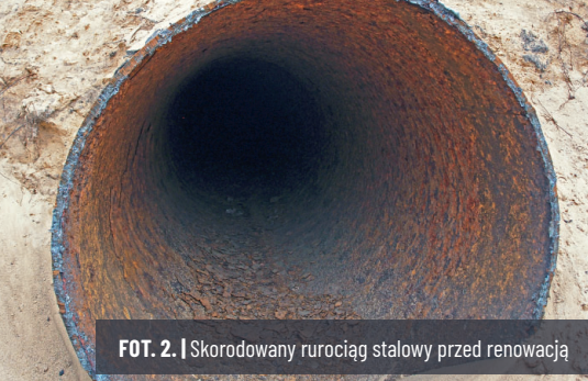
FOT. 2. | Skorodowany rurociąg stalowy przed renowacją