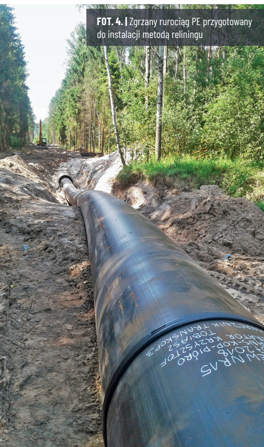
FOT. 4. | Zgrzany rurociąg PE przygotowany do instalacji metodą reliningu

2018 r. Podczas tych prac należało utrzymać w miejscu zgrzewania dodatnie temperatury, dlatego w okresie zimowym konieczne było zastosowanie namiotów i nagrzewnic.