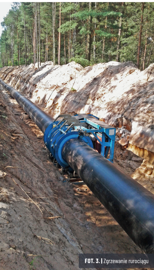
FOT. 3. | Zgrzewanie rurociągu